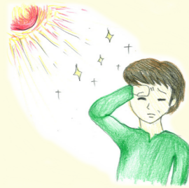
外では まぶしくて見えにくい。

眼の中の水晶体(レンズ)が濁る疾患で、多くは加齢によるものが原因ですが、先天性のもの、アトピー性皮膚炎や糖尿病などの全身疾患、薬剤(ステロイド)によるもの、眼の病気やけがに続いておこるものなどがあります。症状はかすむ、まぶしい、二重に見える、眼鏡の度が変わった、などの症状があらわれ、次第に視力が低下してしまいます。治療は初期の状態であれば進行を遅らせる点眼薬がありますが、残念ながらあまり効果はありません。症状が進行し生活に不便を感じるようになれば、手術が必要です。現在全国では年間100万件の方が白内障手術によって視力をとりもどしています。