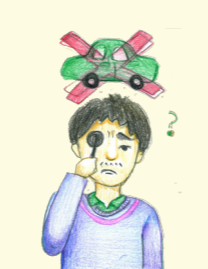
視力が0.7以下になって 運転免許の更新ができない。