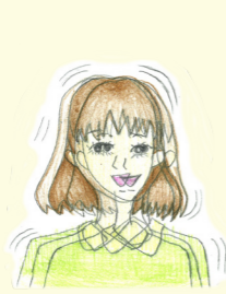
二重、三重に見える