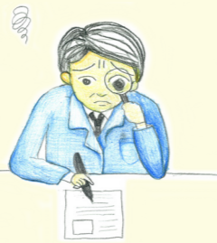
視力が低下して 仕事に支障がある