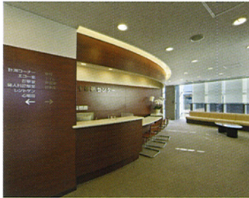
健診センター受付