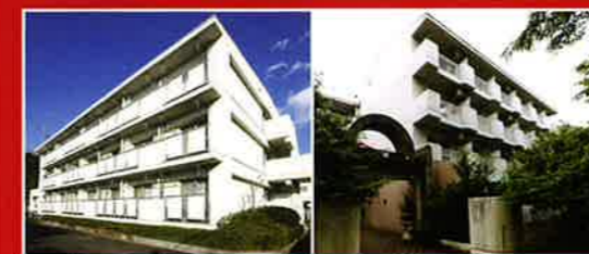
松戸市立病院 / 看護師寮