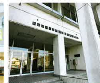
附属看護専門学校