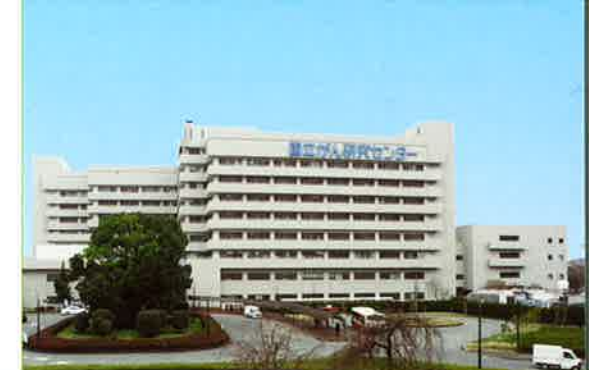
National Cancer Center Hospital East