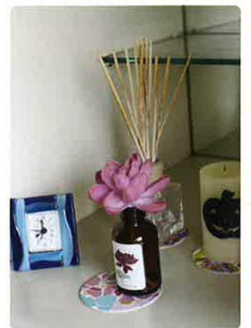
寮の部屋は個性あふれる空間です。ひと息ついて明日に備えます!