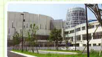
① ららぽーと柏の葉