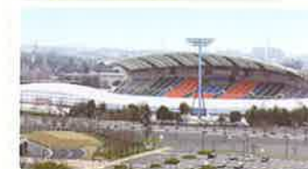
③ 柏の葉総合競技場