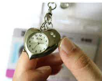
脈拍を計るのに必須の時計。ハートの形は患者さんにも好評です。