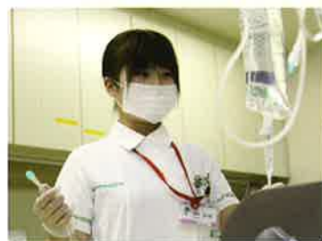
チェックを怠らず、常に細心の注意を払って職務にあたります。