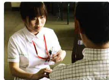
患者さんの不安を少しでも取り除くようコミュニケーションはかかせません。