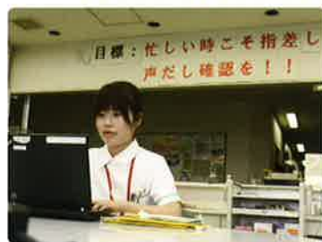
忙しい日々の始まり。そんな時こそ声だし確認!

とにかく、体調を崩さないように日々の生活スタイルに気を配っています。プライベートもしっかり楽しんで仕事に臨んでいます!