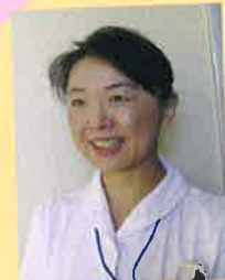
整形外科 主任看護師

私は専門学校を卒業後、当院で働きながら通信制の大学、大学院を修了しました。現在主任として、また、がん化学療法認定看護師として病院の質を高めるため、充実した日々を過ごしています。学びたい気持ちを後押ししてくれる病院です。やりがいのある病院と一緒に看護の学びを深めてみませんか？