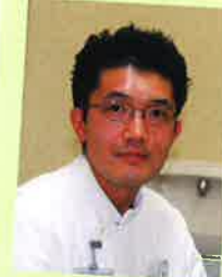
外科病棟 主任看護師 がん化学療法認定看護師

外科病棟で働きだして4年が経ちました。知識や技術の未熟さから落ち込むこともありましたが、そのような時、先輩のアドバイスと患者さまの笑顔が私を支えてくれました。最近ではベッドサイドの時間も増え、自分の成長を実感できることも多くなりました。これからも患者さまに密着した看護が提供できるよう、日々努力していきたいと思います。