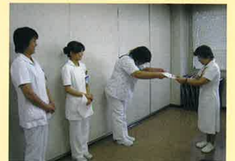
リンカース 認定式 場面

患者さまへの質の高い看護を提供するという使命を忘れないように、院内認定制度を設けています。年間計画に沿った所定の研修を修了し、院内認定試験に合格した証として、看護部長から認定書を進呈しています。学んだ知識・技術を新人看護師の指導や現場教育を通して、1人ひとりの自覚や向上心につなげています。