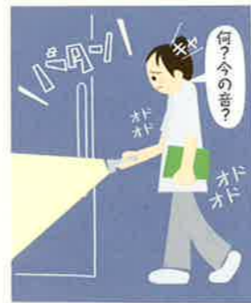
新しくきれいな病院なので、夜勤で暗くなっても怖くないですよ。