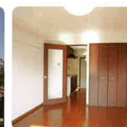
明るくて収納たっぷり

新築間もないので、オートロック・モニター付インターフォンなど設備はバッチリです。病院から徒歩5分。