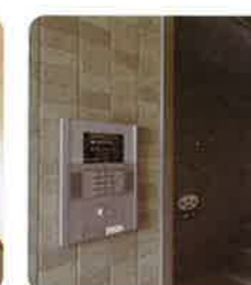
セキュリティもバッチリ