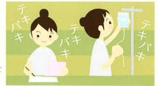
技術の独り立ちもあとわずか!

出来るが増えた反面、苦手なこと、足りない部分が見えてきた毎日。この先やっていけるか不安だった。