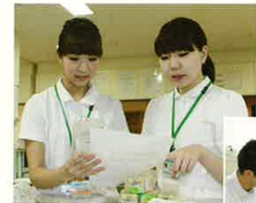
先輩を通じていろいろな学んでいきます。