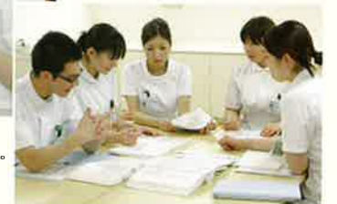
同期の仲間と勉強会。問題を共有し知識を深めます。