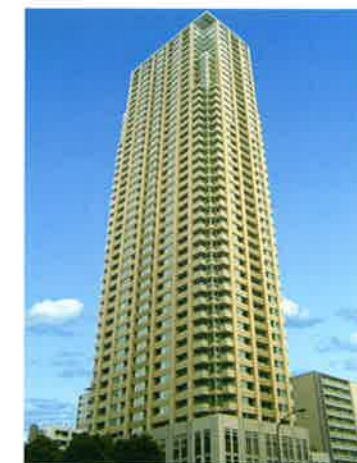
青山一丁目タワー4・5階に東京青山キャンパスがあります。

主な授業が平日の夕方6時以降、及び土曜日の昼間に開講されていますので、働きながら学ぶことができます！