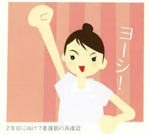
2年目に向けて看護観の再確認