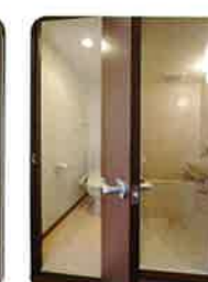
トイレとユニットバスが独立設計