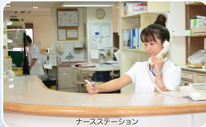
ナースステーション

再生不良性貧血や特発性血小板減少症、骨髄異形成症候群などの診療を行っております。