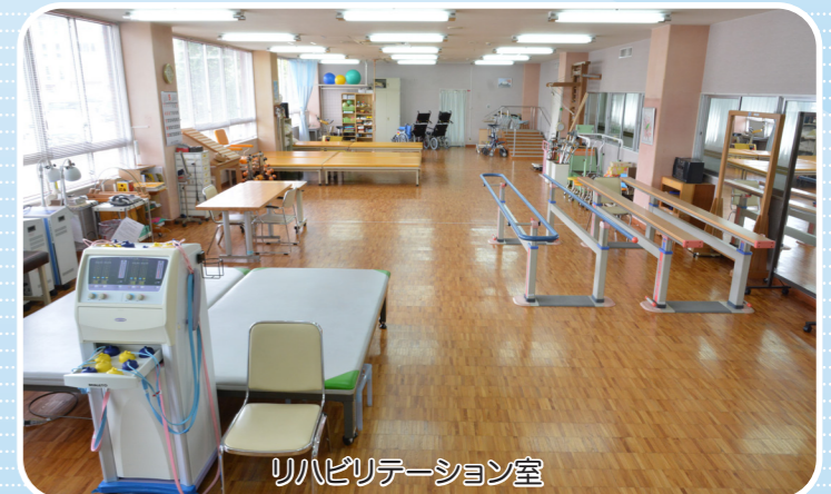
リハビリテーション室